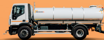
Cisterna za pitku vodu