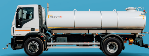
Cisterna za vodu